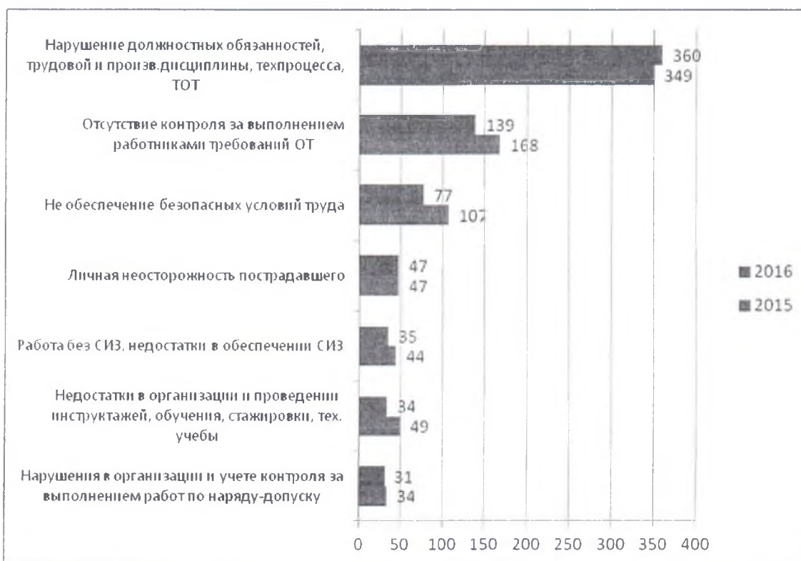
Рисунок 1- Основные нарушения работников ОАО «РЖД», повлиявшие на возникновение травм на производстве в 2015-2016 гг.

Оценка влияния человеческого фактора как в 2015 году, так и в 2016 году проводилась на основе «Методики оценки влияния человеческого фактора на возникновение случая травмы на производстве и определения доли ответственности причастных работников к этому событию», введенной в действие с 1 января 2015 года распоряжением ОАО «РЖД» от 28 ноября 2014 г. № 2777р. Анализ действия Методики за 2 года показал, что изучение влияния человеческого фактора и проводимая на его основе профилактическая работа позволяют минимизировать ряд нарушений при производстве работ в подразделениях филиалов ОАО «РЖД».